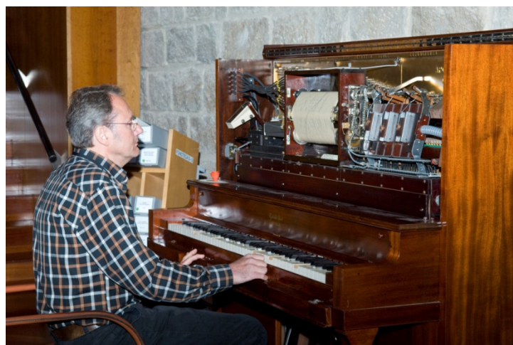
Actuació de pianola a la Jornada de Portes Obertes