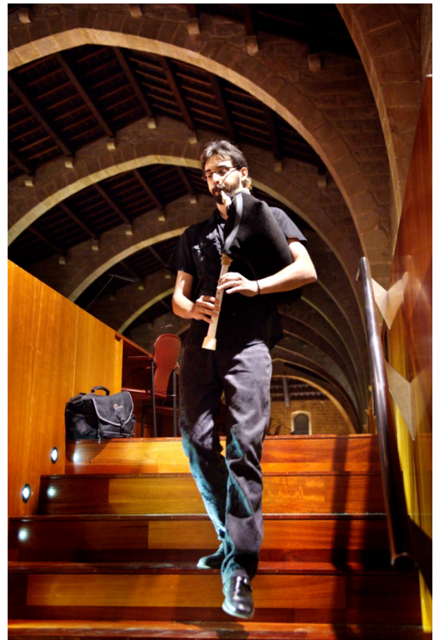
Concert de cornamussa

D'altra banda, la BC ha cedit els seus espais per a diferents activitats: rodes de premsa, congressos, reunions, gravacions, reportatges fotogràfics, etc.