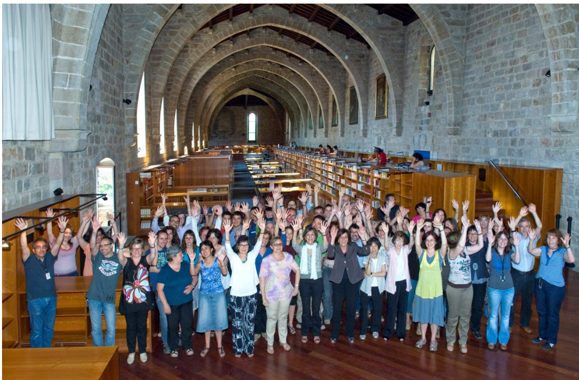
Treballadors de la BC

8 persones han fet una estada en altres unitats de treball. La valoració global mitjana de les estades ha sigut de 4,25 sobre 5.